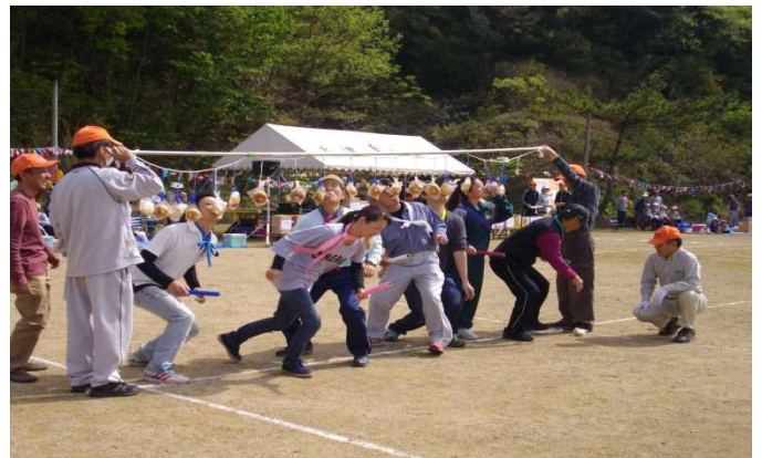
逃げるパンに、まって！！