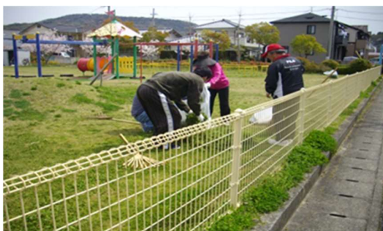
桜を見ながら作業中

草刈はおまかせください！元沖町公園の草刈りの草集めの作業に行きました。桜満開の公園は、晴天で気持ち良く作業ができました。