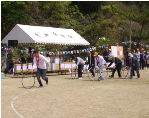
思うように進まぬ車輪に苦戦中

前夜の雨でグラウンドの状況が心配されましたが、水はけがよいグラウンドに熱戦が展開されました。小学6年の男女の宣誓で始まり、綱引き、紅白玉入れ、パン食い競争、車輪回しなど、懐かしい競技に老若男女の歓声が響きました。