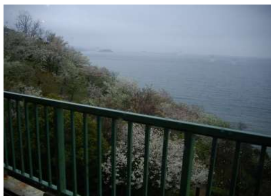
桜越しに瀬戸内海を見る