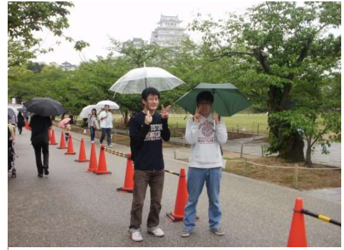
お城をバックに仲良し二人組