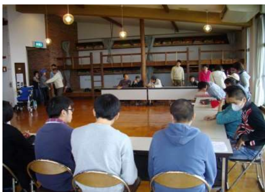
楽しくゲームをする利用者の皆さん

お弁当を開きながら楽しい会話も弾みました。賞品ゲットを目指したビンゴゲームは盛り上がりました。