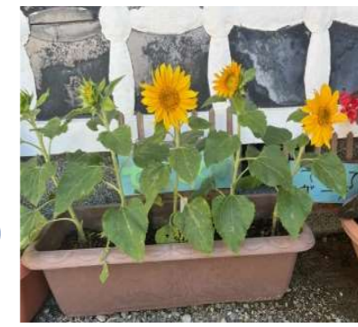
てくてくガーデン