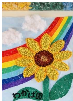
生活介護利用者様の壁画

生活介護では、利用者様が季節の壁画を意欲的に取り組まれています。又散歩中に見かけた、「ていじゅうろうバスに乗りたい」との声があり、少人数に分けて乗車をし楽しめました。「また乗りたい！」と笑顔で言っておられました。夏祭りでは、ご家族様と一緒にゲーム等をされ盛り上がりしました。今後も利用者様の思いを活かし、楽しい活動、行事を職員一同考えてまいります。