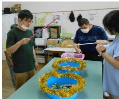
楽しんだ夏祭り（釣りゲーム・的あて）